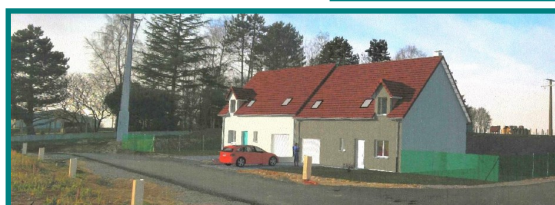
2 LOGEMENTS DE TYPE 4 (séjour et 3 chambres)