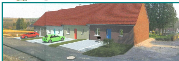
4 LOGEMENTS DE TYPE 2 (séjour et 1 chambre)