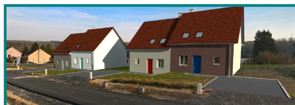
4 LOGEMENTS DE TYPE 3 (séjour et 2 chambres)